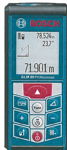
Рисунок 2 - Общий вид дальномеров лазерных GLM 80 Professional

Опломбирование узлов дальномеров не производится, ограничение доступа к узлам обеспечено конструкцией крепёжных винтов, которые могут быть сняты только при наличии специальных ключей.